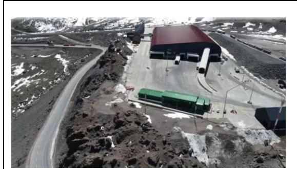
2.- Vista Aérea Costado Sur