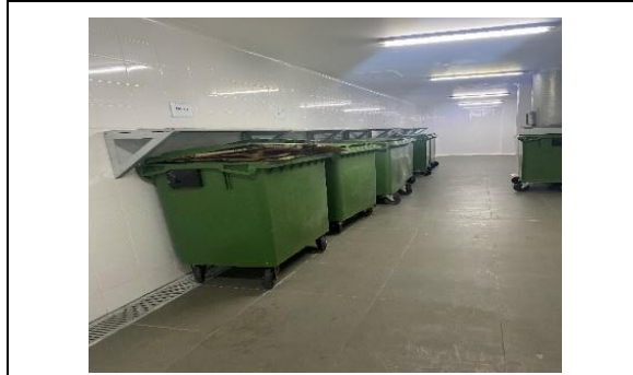
4.- Zona de Depósitos Residuos Sólidos