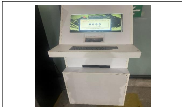
6.- Conexión Wi Fi