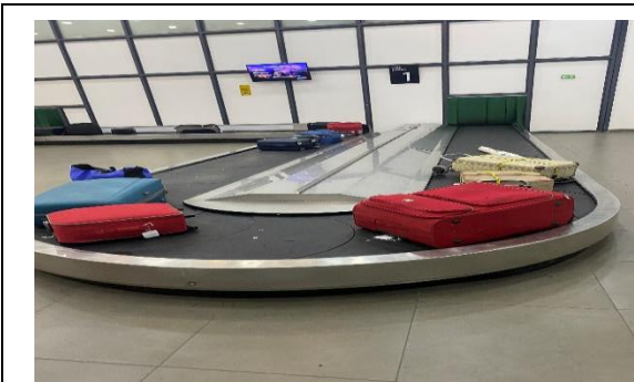
5.- Servicio Cintas Transportadoras de Equipaje