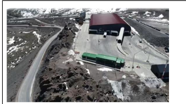
2.- Vista Aérea Costado Sur