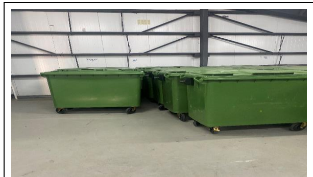
4.- Sala Compactación de Basura