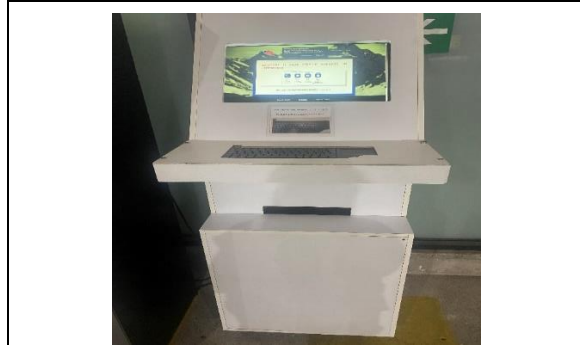
6.- Servicio Información al Público