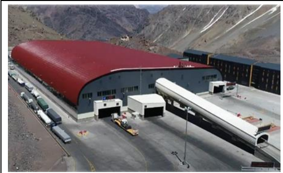
1.- Vista Aérea Costado Norte