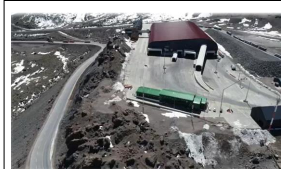
2.- Vista Aérea Costado Sur