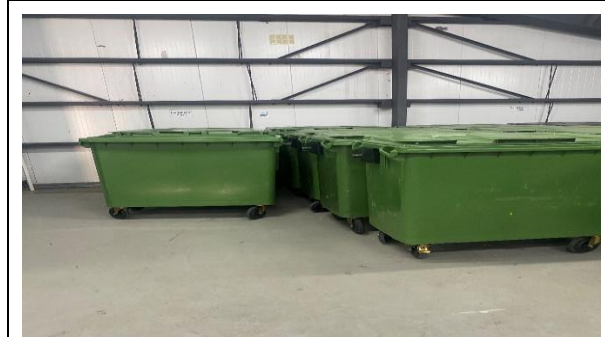
4.- Sala Compactación de Basura