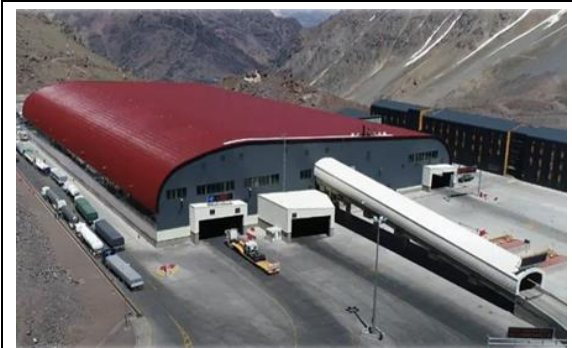
1.- Vista Aérea Costado Norte