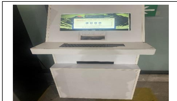
6.- Servicio Información al Público