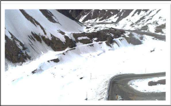
1.- Vista Aérea Camino NCFL