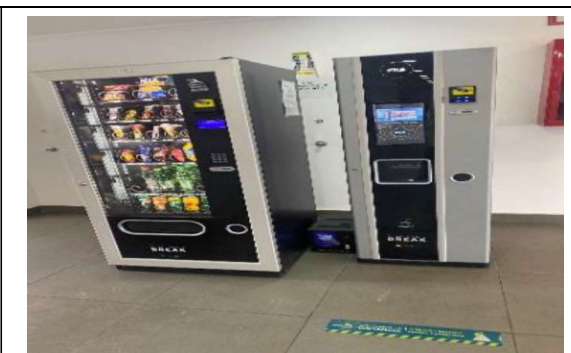
5.- Servicio Alternativo Alimentación