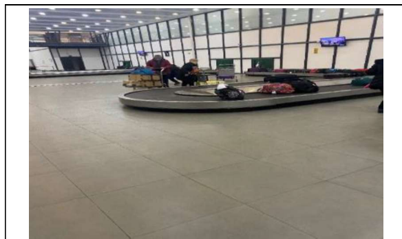
4.- Cintas Transportadoras de Equipaje