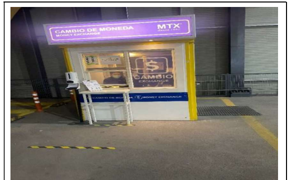
6.- Servicio Comercial Ámbito Financiero