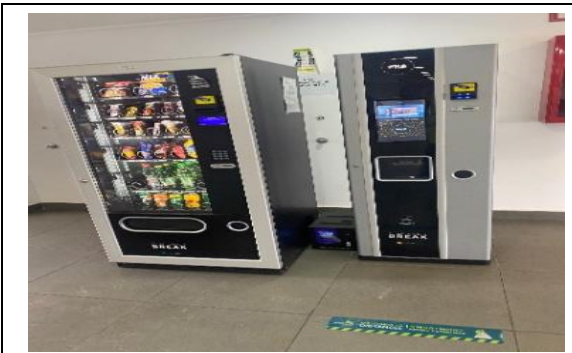
5.- Servicio Alternativo Alimentación