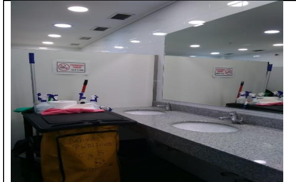
2.- Baños Públicos 3º piso