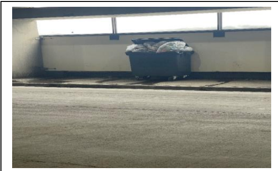
3.- Isla Ecológica.