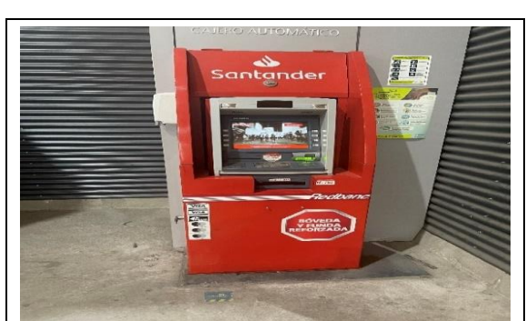
6.- Servicio Comercial Ámbito Financiero