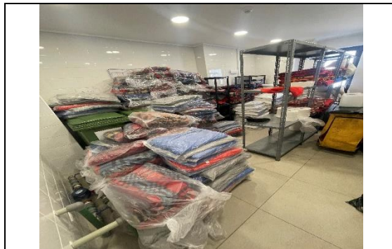
6.- Servicio de Lavandería