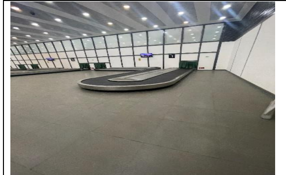
2.- Cintas Transportadoras de Equipaje