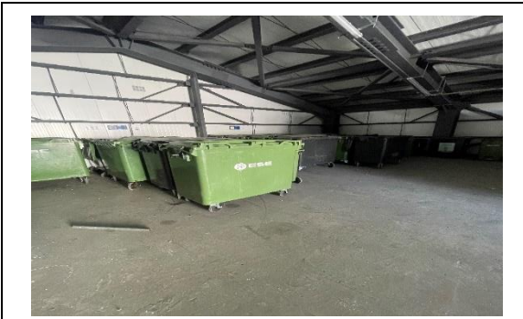
3.- Isla Ecológica.