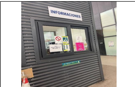
5.- Servicio Información al Público.