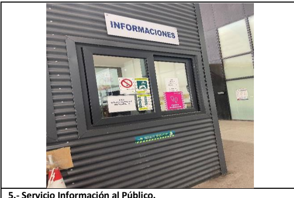
5.- Servicio Información al Público.