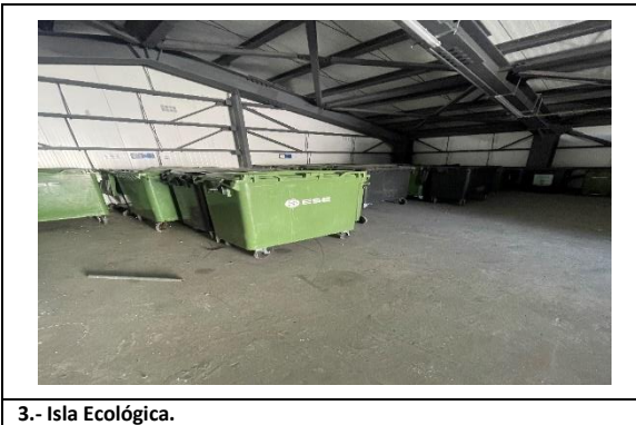
3.- Isla Ecológica.