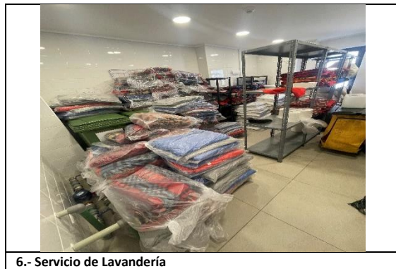
6.- Servicio de Lavandería