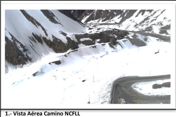
1.- Vista Aérea Camino NCFLL