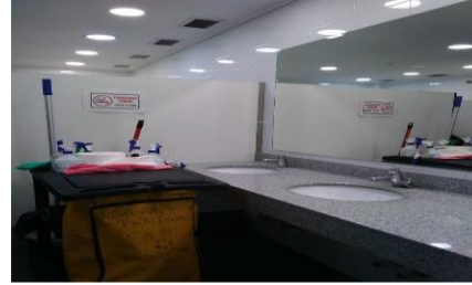
2.- Baños Públicos 3º piso