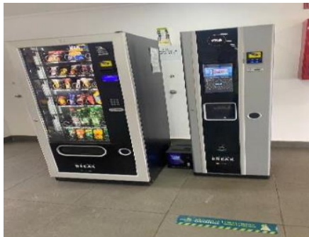
5.- Servicio Alternativo Alimentación