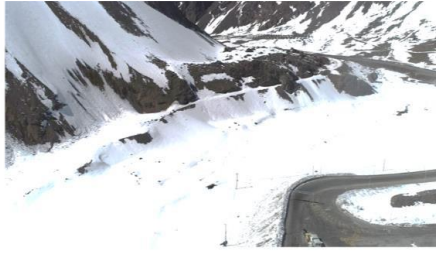
1.- Vista Aérea Camino NCFL