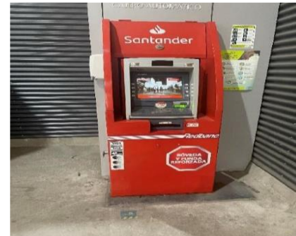
6.- Servicio Comercial Ámbito Financiero