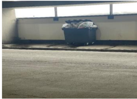
3.- Isla Ecológica.