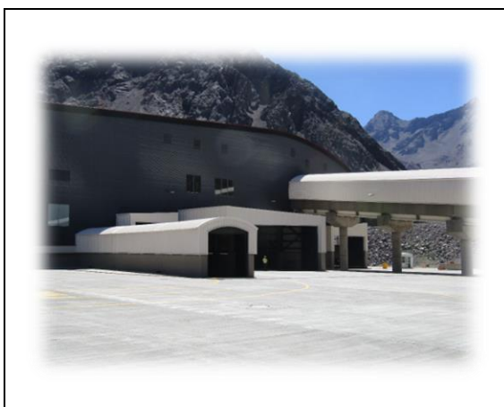
5.- Vista Ingreso Sur NCFL