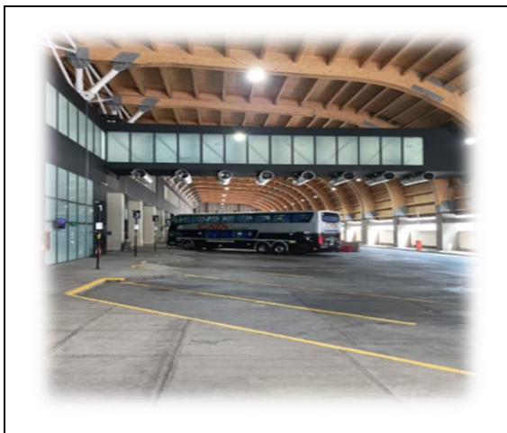
3.- Vista Estacionamientos Buses