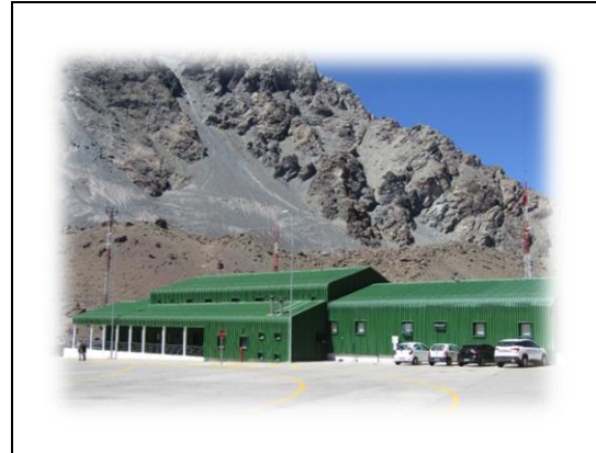
2 Vista Edificio de Carabineros