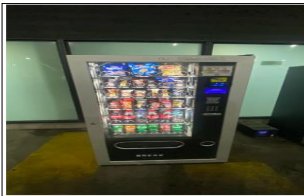
5. Maquina de Alimentos Complejo