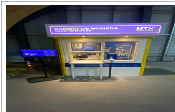
1. Casa de Cambio MTX