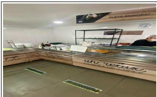
6. Servicio de Alimentación