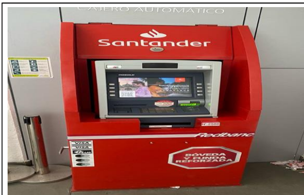
3. Cajero Automatico Complejo