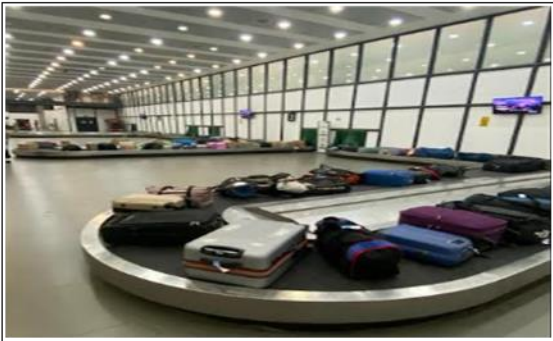
3. Vista Cintas Transportadoras Equipaje