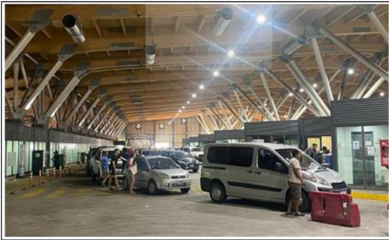
1. Vista Ingreso Vehículos Livianos