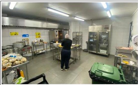
5. Vista Interior Cocina de Casino