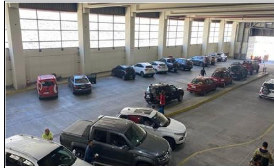
2. Vista Control Migratorio (sector buses)