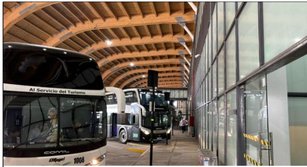
1. Zona de Buses