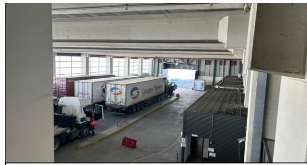
4. Zona de Camiones