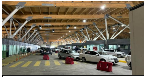
2. Zona de Vehículos Livianos