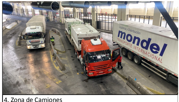
4. Zona de Camiones