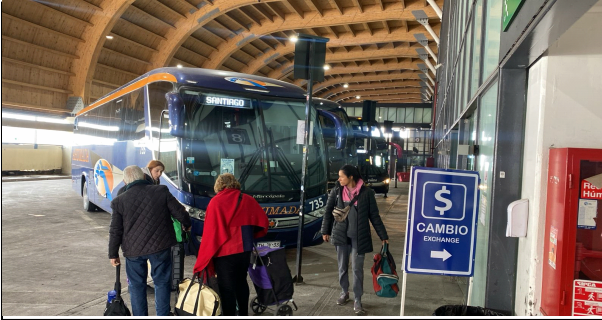
1. Zona de Buses