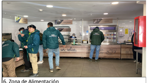
6. Zona de Alimentación