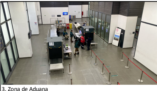
3. Zona de Aduana