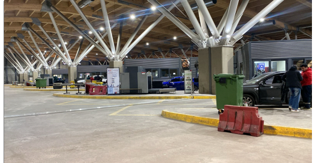
2. Zona de Vehículos Livianos