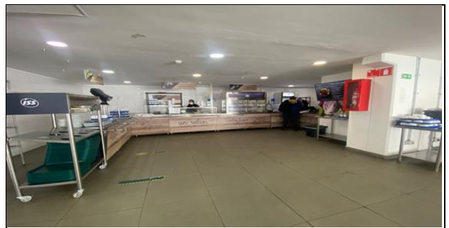
6. Zona de Alimentación