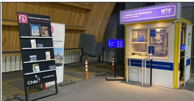
5. Zona Servicios