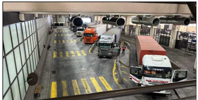
4. Zona de Camiones