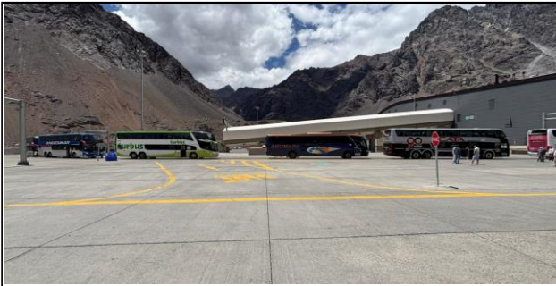
1. Zona de Buses