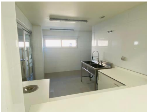
Lavaplatos, 2do piso Edificio Transitorio COAR