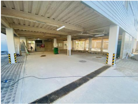
Acceso Estacionamientos Edificio Transitorio COAR