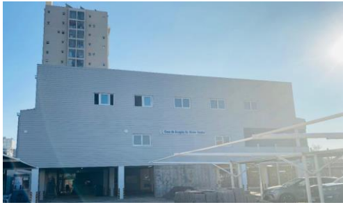
Fachada Principal Edificio Transitorio COAR