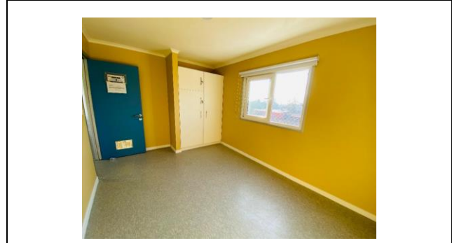
Dormitorio, 3er piso Edificio Transitorio COAR