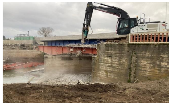
Ilustración N°6 Rehabilitación Puente Huequén CI