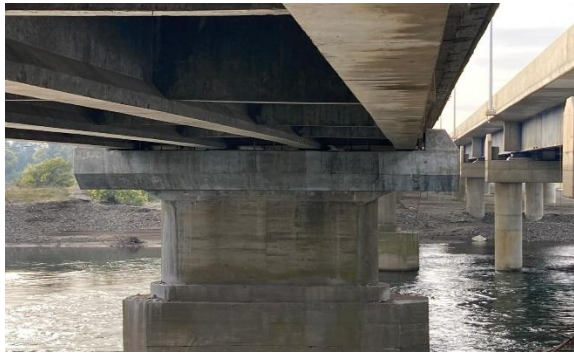
Ilustración N°1: Rehabilitación Puente Coihue