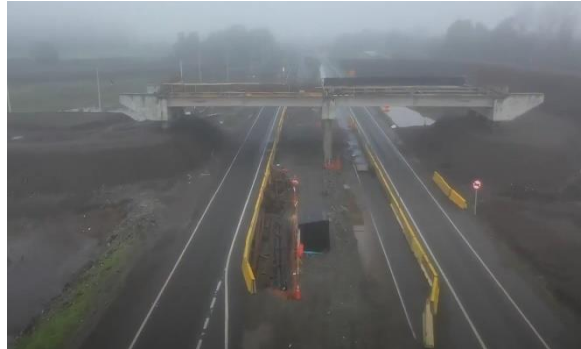
Ilustración N°4: PI Retorno Chequén