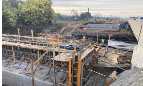
Ilustración N°2: Rehabilitación Puente La Suerte