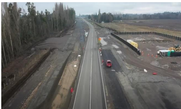
Ilustración N°3: Área Control Carreteras