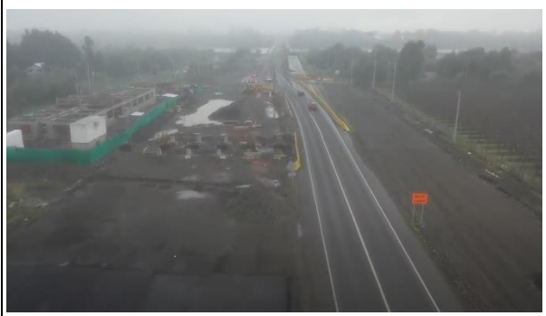
Ilustración N°4: Plaza Peaje Troncal Coihue