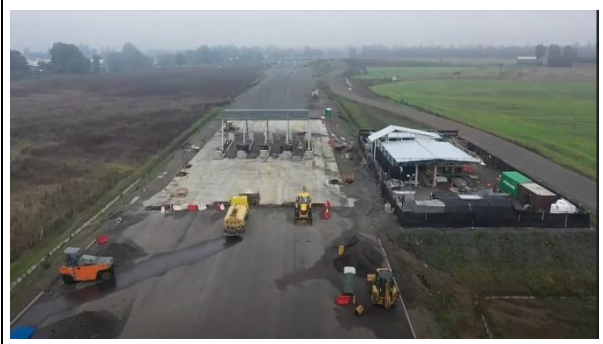
Ilustración N°6 Plaza Peaje Troncal Renaico