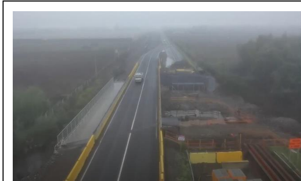
Ilustración N°1: Rehabilitación Puente La Suerte