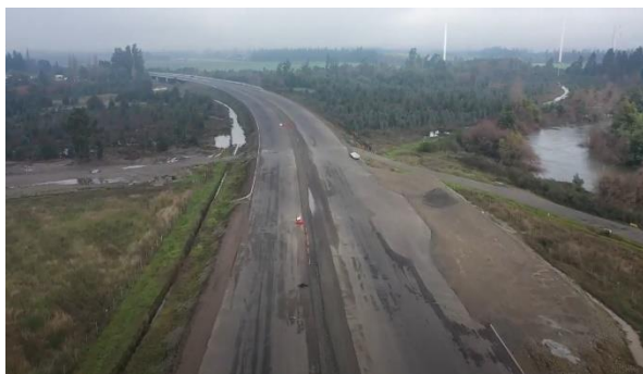
Ilustración N°5: Variante Renaico