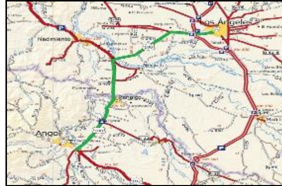
En verde, emplazamiento en Región Biobío y Araucanía

El Proyecto contempla el Mejoramiento y Ampliación a doble calzada de la Ruta 180, en el tramo comprendido entre Avda. Camilo Henríquez en la Ciudad de Los Ángeles Dm. 0.000 y Avda. O’Higgins en la Localidad de Huequén, Comuna de Angol, Dm. 55.020.