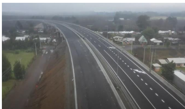
Ilustración N°3: Viaducto Coihue