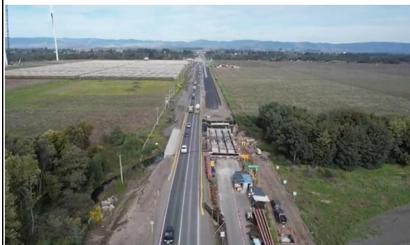
Ilustración N°3: Rehabilitación Puente La Suerte