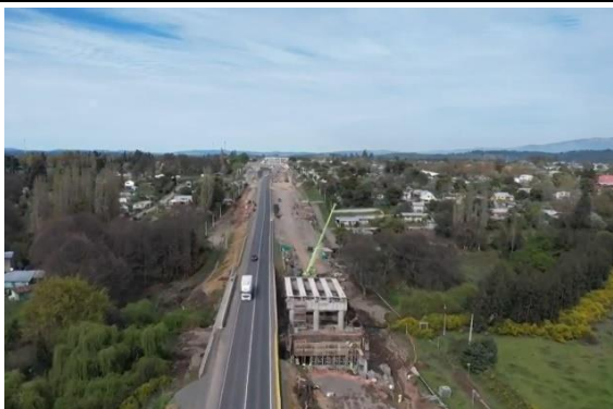
Ilustración N°5: Puente Tijeral CD