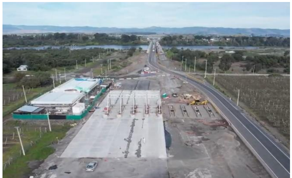
Ilustración N°4: Peaje Troncal Coihue