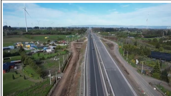
Ilustración N°1: Eje Troncal 2 sector PS Las Violetas