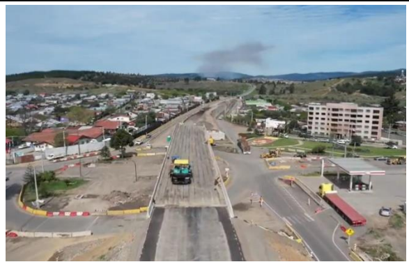
Ilustración N°6 PS Huequén