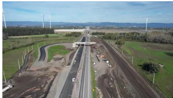
Ilustración N°2: PI Retorno Chequén