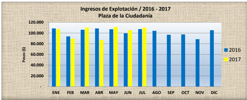
INGRESOS MENSUALES - AÑO 2017 Desglosados por tipo de servicio (en M$)

Los ingresos de Explotación del Concesionario provienen de la explotación del estacionamiento por usuarios ocasionales, también denominados clientes de Rotación Horaria, cuya recaudación puede ser a través de CHIP COIN y TAG; del arriendo de estacionamiento a usuarios abonados o arriendos mensuales; del arriendo de Locales Comerciales, de Publicidad y otros.