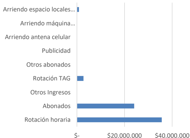
PDLC - Ingresos Explotación ($) OCTUBRE 2022