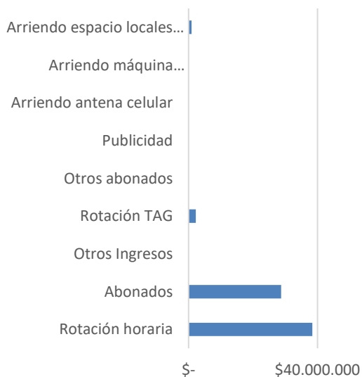
PDLC - Ingresos Explotación ($) OCTUBRE 2023