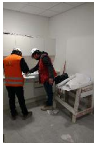
Avance en Unidad de Esterilización