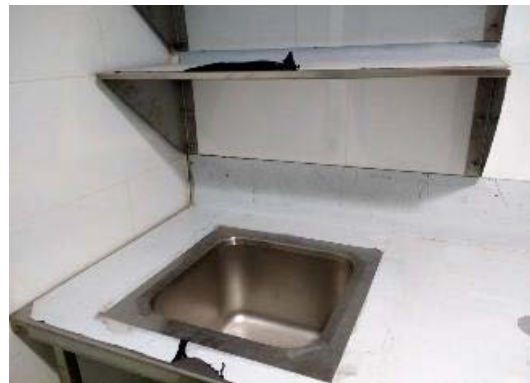
Artefactos sanitarios Unidad de Farmacia