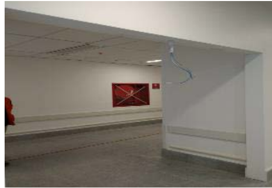
Avance en terminaciones generales