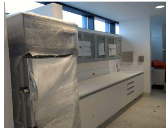
Avance Estación de Enfermería