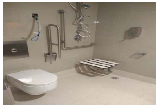
Avance en baños