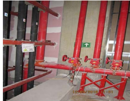
Avances alimentación vertical de extinción