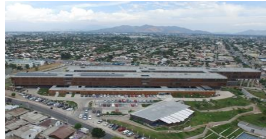
Concesión Hospital de La Florida

Corresponde a un Establecimiento Hospitalario de mediana complejidad en el que se entrega Atención Hospitalaria (Cerrada) y Atención Ambulatoria (Abierta). El Hospital tiene una capacidad de 391 camas.