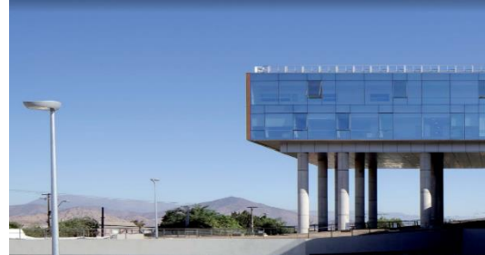
Concesión Hospital de La Florida

Corresponde a un Establecimiento Hospitalario de mediana complejidad en el que se entrega Atención Hospitalaria (Cerrada) y Atención Ambulatoria (Abierta). El Hospital tiene una capacidad de 391 camas.