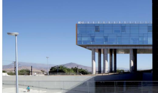
Concesión Hospital de La Florida

Corresponde a un Establecimiento Hospitalario de mediana complejidad en el que se entrega Atención Hospitalaria (Cerrada) y Atención Ambulatoria (Abierta). El Hospital tiene una capacidad de 391 camas.