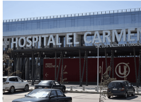
Concesión Hospital de La Florida

Corresponde a un Establecimiento Hospitalario de mediana complejidad en el que se entrega Atención Hospitalaria (Cerrada) y Atención Ambulatoria (Abierta). El Hospital tiene una capacidad de 391 camas.