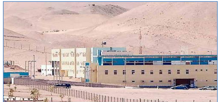
Establecimiento Penitenciario de Alto Hospicio