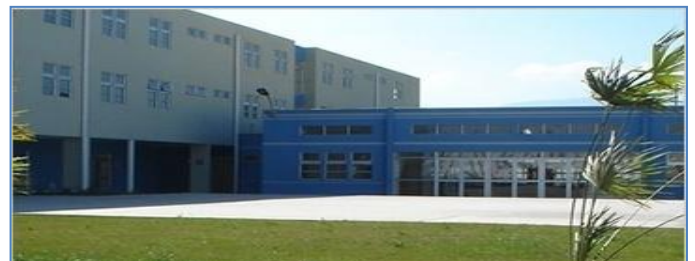
Establecimiento Penitenciario de Rancagua