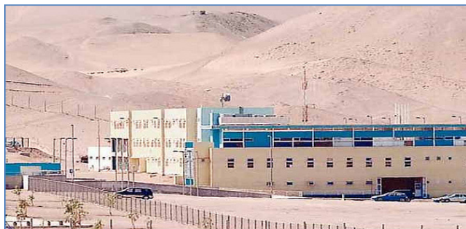
Establecimiento Penitenciario de Alto Hospicio