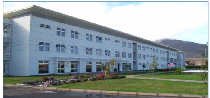
Establecimiento Penitenciario de La Serena