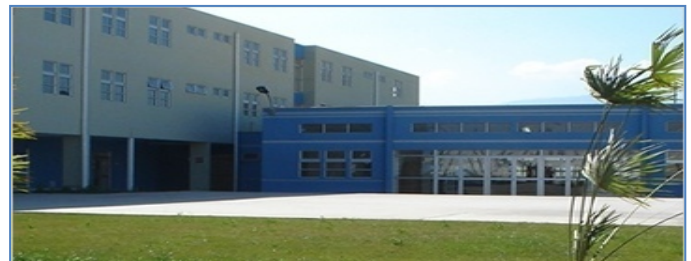
Establecimiento Penitenciario de Rancagua