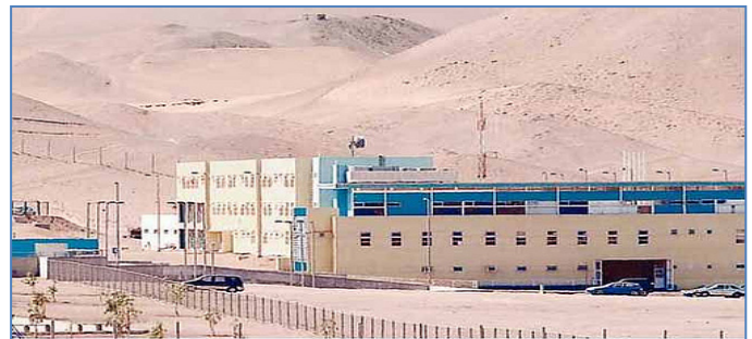
Establecimiento Penitenciario de Alto Hospicio