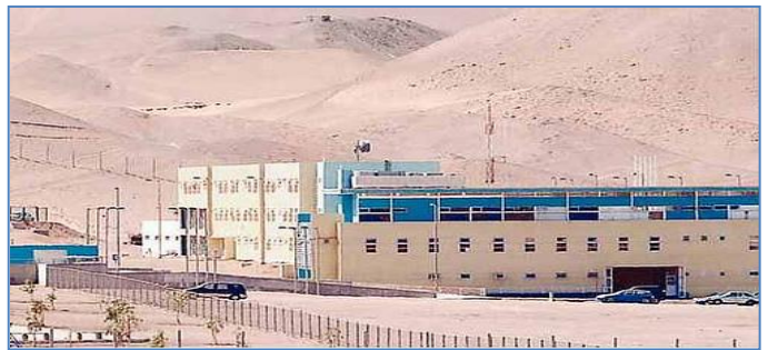
Establecimiento Penitenciario de Alto Hospicio