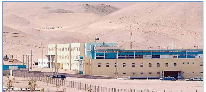
Establecimiento Penitenciario de Alto Hospicio