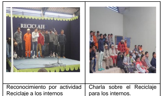
Reconocimiento por actividad Reciclaje a los internos

Establecimiento Penitenciario de Antofagasta: Se realiza "Campaña de Reciclaje" en el gimnasio del recinto con la participación activa de los internos, en la cual se realiza una breve charla en relación a este tema. Posteriormente se entrega un reconocimiento a todos los internos trabajadores y monitores de los módulos que participan recolectando tapas de bebidas y botellas para un fin benéfico