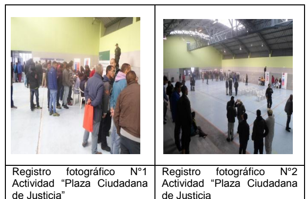
Registro fotográfico N°1 Actividad "Plaza Ciudadana de Justicia"

Se desarrolló de la actividad "Plaza Ciudadana de Justicia" la cual se efectúa todos los años en el Recinto Penitenciario, siendo ésta, propuesta por Gendarmería de Chile y la SEREMI de Justicia de la Octava Región, en beneficio de la población penal. Tal acción; se llevó a cabo el pasado 12 de septiembre del año en curso.