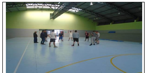
Registro fotográfico N°3: Participación del curso con internos

Dentro del mes de Julio, corresponde al Curso de Formación de Monitores Deportivos, focalizado en internos participantes provenientes de diversas agrupaciones modulares. Cabe precisar que la función principal de esta actividad consiste en que los beneficiarios se hagan cargo de toda acción deportiva en sus respectivos módulos de reclusión, además de ser el representante de los internos toda vez que se reemplace algún implemento deportivo (pelota de baby futbol, naipes, pelotas de ping-pong, paletas, entre otros). A ello se agrega ser el representante de su agrupación cuando se desarrollan campeonatos deportivos.