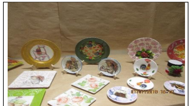
Registro fotográfico N°2: Presentación de lo efectuado en el curso.