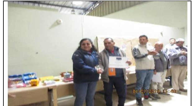
Registro fotográfico N°1: Certificación del curso

Durante el mes de julio, se efectuó certificación de curso de habilidades artesanales "decoupage y pañolenci". Este curso forma parte de la oferta de actividades del Subprograma de Capacitación Laboral, dirigido a internos que requieran desarrollar habilidades en esta área para completar su Plan de Intervención Individual.