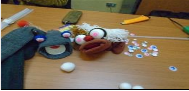
Supervisión atención 8.03 talleres laborales M55-56-62.