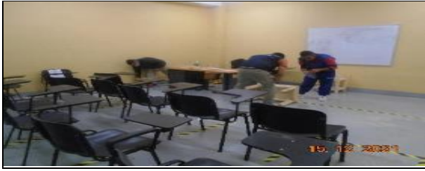
Supervisión Diseño e impresión en 3D