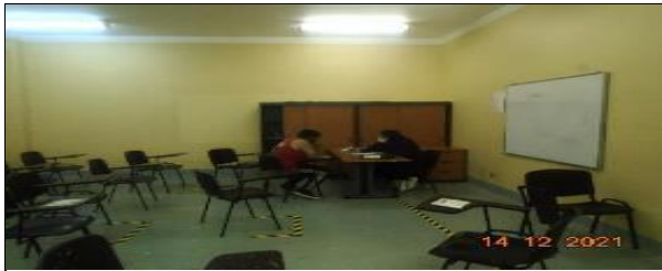
Supervisión atención 8.03 Monitor Laboral en Talleres Laborales.