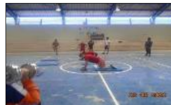
Segundo Consejo Escolar Liceo Coresol