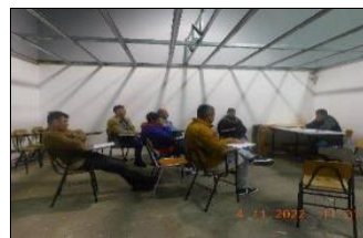
Desarrollo de Taller de Arte en módulos 46