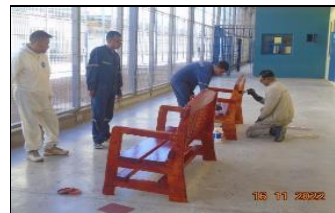
Final campeonato Teletón 2022.

Taller capacitación en oficio de mueblería