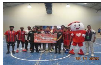
Inducción de trabajadores modalidad dependiente