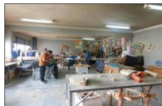
Supervisión Curso 7.06 Electricidad M55-56-62

Supervisión Atención Monitor Laboral M41-42,43-44,46,55-56,61-62 y RE.