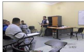
Supervisión Atención Monitor laboral Módulo 55-56 y 62.