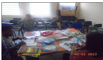
Visita taller artesanal