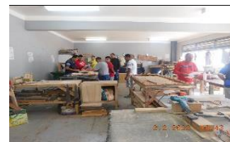
Supervisión curso 7.06 Administración de Bodega M61-62, Sala CDI.