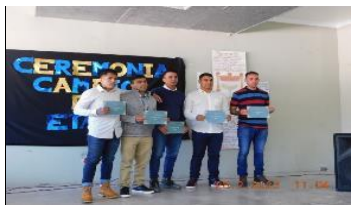
Taller artístico N° 1

Ceremonia de cambio de etapa del Centro de Tratamiento en Adicciones.