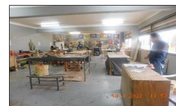
Supervisión Charla difusiones masivas

Supervisión Atención Monitor Laboral Módulos 41-42, 43-44, 46, 55-56, 61-62.