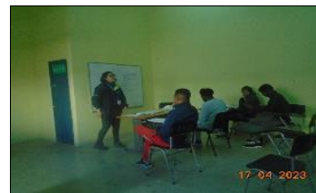
Visita Capacitación en Oficio Electricidad

Taller de preparación para el egreso del programa psicosocial.