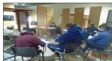
Taller en Atención de Adicciones M-72 Comunidad Terapéutica EP Antofagasta.