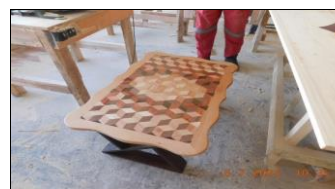
Difusión masiva de laboral y capacitación laboral