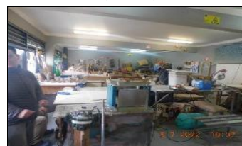
Supervisión curso Capacitación en oficios "Paneles Solares", Comunidad terapéutica

Supervisión Atención Monitor Laboral Módulos 41-42, 43-44, 46, 55-56, 61-62.