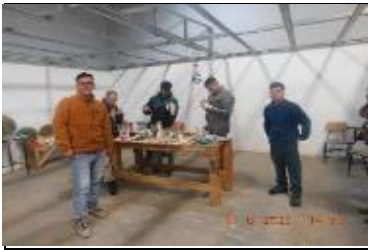
Supervisión Curso 7.06 "Decoración con material reciclado" Supervisión curso 7.10 M56