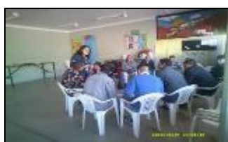
Visita taller artesanal