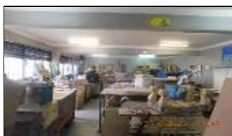
Supervisión Curso Capacitación en oficios "Orfebrería"

Supervisión Atención Monitor Laboral Módulos 41-42, 43-44, 46, 55-56, 61-62.