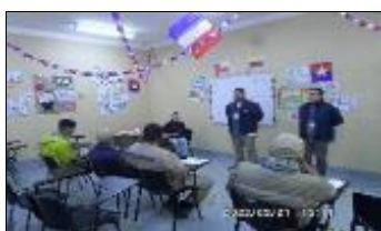
Monitor laboral módulo 9

Desarrollo de Taller de Prevención Selectiva