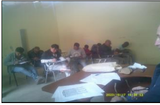
Fiscalización Taller Prevención selectiva Subprograma Adicciones Servicio RS