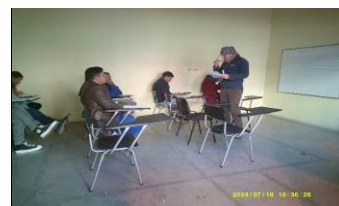
Se fiscaliza capacitación de oficio en soldadura