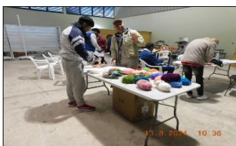
Se fiscaliza clases en el módulo 43.

Fiscalización taller de habilidades artesanales en mándalas.