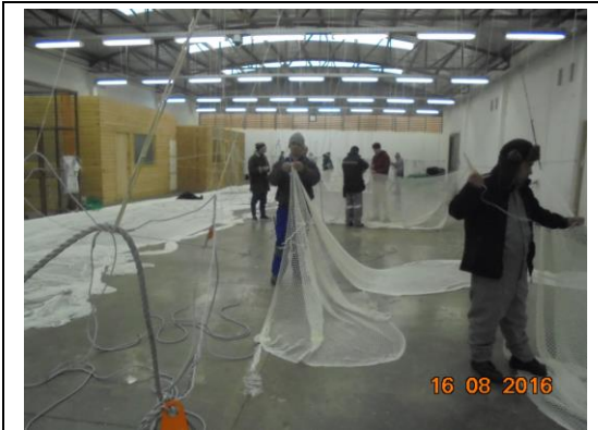
IMG. N° 002 Reinserción Social: Subprograma de Capacitación Laboral, EP Puerto Montt.

Comentario: Con fecha 16 de agosto se fiscaliza Curso de Capacitación Artesanía en Red, correspondiente al Sub Programa Laboral, ejecutado en dependencias de las Salas de TAI 3, contando con la participación de 11 internos multi-módulos.