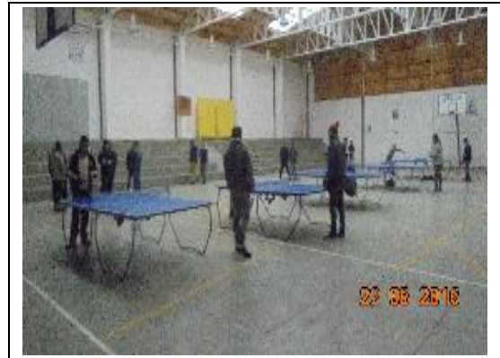
IMG. N° 003 Reinserción Social: Subprograma Deporte, Recreación, Arte y Cultura, EP Valdivia

Comentario: Con fecha 16 de agosto se fiscaliza Curso de Capacitación Artesanía en Red, correspondiente al Sub Programa Laboral, ejecutado en dependencias de las Salas de TAI 3, contando con la participación de 11 internos multi-módulos.