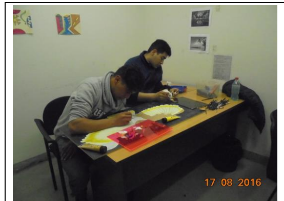
IMG. N° 001 Reinserción Social: Subprograma Deporte, Recreación, Arte y Cultura, EP. Santiago 1

Comentario: En el marco de actividades sistemáticas, se desarrolla actividad cultural. La imagen muestra internos desarrollando taller de pintura, los cuales han ido adquiriendo la técnica para la pintura logrando realizar sus propias obras.