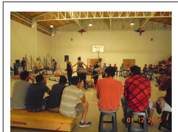
IMG. N° 001 Reinserción Social: Subprograma Deporte, Recreación, Arte y Cultura

Comentario: El día 01-12-2016, en el marco del Subprograma DRAC., se presentó en dependencias del Gimnasio del Establecimiento Penitenciario la obra de teatro "Laboratorio", actividad a la cual asistieron los imputados de los módulos 33-34, un total de 265 internos según cuenta de deserción del día.