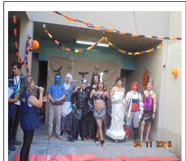
IMG. N° 001 Reinserción Social: Subprograma Deporte, Recreación, Arte y Cultura

Comentario: El día 04-11-2016, en el marco del Subprograma Psicosocial, el equipo de profesionales del Servicio en conjunto con la población penal del Módulo 87 preparó un taller de elaboración de disfraces, los cuales presentaron una actividad artística-recreativa que denominaron "Fashion Haloween".