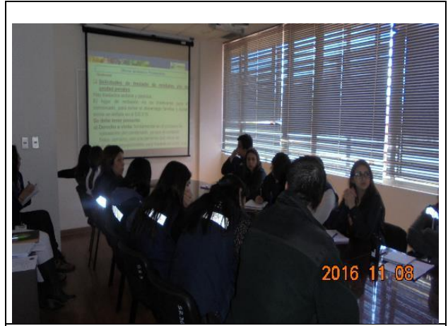
IMG. N° 002 Reinserción Social: Subprograma Deporte, Recreación, Arte y Cultural, EP Puerto Montt.

Comentario: Con fecha 08-11-2016 en dependencias de la sala de reuniones de Gendarmería, se desarrolla exposición de la Defensoría Penal Penitenciaria, sobre el tema: Ejecución de la pena y derechos humanos. Asisten: equipo psicosocial de la Sociedad Concesionaria, profesionales de Gendarmería de Chile, Supervisores de la ITE, y miembros del equipo jurídico-social de la Defensoría Regional.