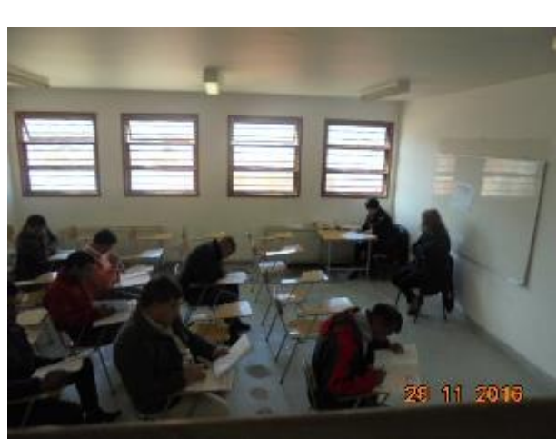
IMG. N° 003 Reinserción Social: Subprograma Educación, EP Valdivia

Comentario: Durante los días 28 y 29 de noviembre del presente año, se lleva a cabo proceso PSU (Prueba de Selección Universitaria) 2017; actividad que cuenta con un total de 26 internos que se presentan a rendir las pruebas de selección universitaria (6 corresponden al penal de Río Bueno): 26 internos rinden prueba de lenguaje, 22 internos rinden prueba de matemáticas, 5 internos rinden prueba de ciencias sociales y 21 internos rinden prueba de historia y geografía.